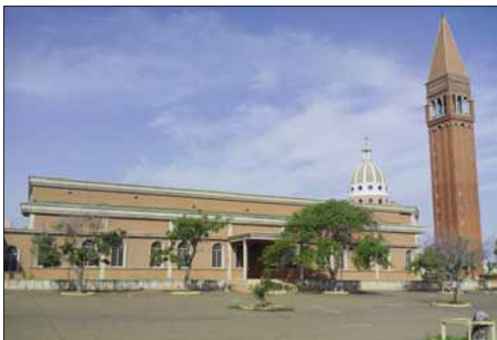
Chiesa di San Francesco d'Assisi e campanile a Maracaibo.

Ho avuto la gioia di presenziare alla consegna solenne del diploma di maturità dei due licei, che là viene chiamato baccellierato. In